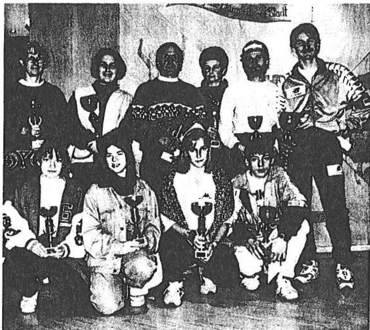
Das ist das Siegerfoto vom ersten Stadtlauf in Großsiegharts.